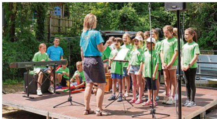
Projekte der Grundschule Engen wurden in der Vergangenheit auch von der Bürgerstiftung unterstützt. Dafür bedankte sich der Grundschulchor mit mitreißenden Songs.