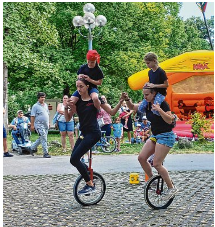
Der Mitmachzirkus Casanietto durfte bei der Jubiläumsfeier der Bürgerstiftung nicht fehlen.