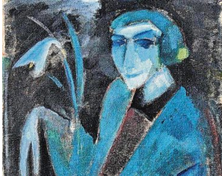
Hermann Stenner, »Damenbildnis mit Lilie«, 1914.

Der Film zur Sonderausstellung kann auf der Homepage des Museums www.museum-engen.de unter der Rubrik »Videothek« angeschaut werden.