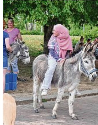
Der »Renner« war die »Esel-Reitstation« - viele Kinder wollten auf dem Rücken von »Anton« und »Ronja« eine Runde drehen.