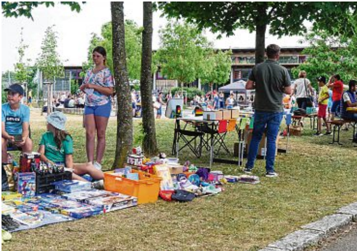
Viele Flohmarktstände luden auf dem Schulgelände zum Stöbern ein.

Das Schul-Flohmarkt-Fest am Bildungszentrum war ein Publikumsmagnet