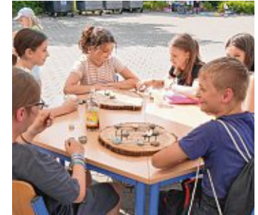
Das gemeinsame Spiel beim Spiele-Café verband: Die Spiele wurden von SchülerInnen selbst hergestellt - mit nachhaltigen Materialien wie Holz und Kieselsteinen.