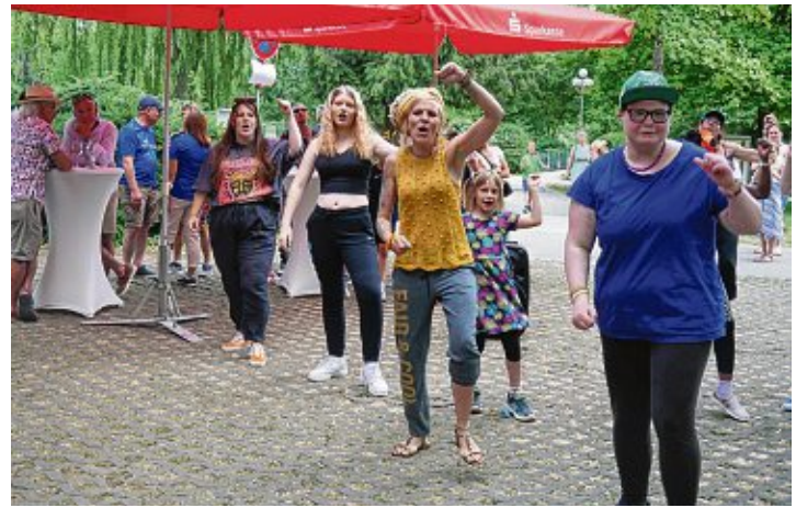
Getanzte Frauen- und Mädchen-Power für die Bürgerstiftung: Die jugendlichen Teilnehmerinnen der Mädchentanzwerkstatt »Fair und Cool« vom Haus am Mühlbach setzen ihre Traumata zusammen mit ihren Betreuerinnen in coole Moves um.

Wer eine Mücke gefangen hat, sendet sie an die Kommunale Aktionsgemeinschaft zur Bekämpfung der Schnakenplage (KABS e.V.), Georg-Peter-Süß-Straße 3 in 67346 Speyer. Diese untersucht die eingesendeten Exemplare. Einsender, Fundort und -datum sollten dafür möglichst genau angegeben werden. Weitere Informationen über die Asiatische Tigermücke und mögliche Kontrollmaßnahmen sind auch auf den Internetseiten des Landesgesundheitsamtes Baden-Württemberg unter der Webadresse gesundheitsamtbw.de/lga/de/kompetenzzentren-netzwerke/arbo-badenwuerttemberg/informationen-zur-tigermuecke/ verfügbar.