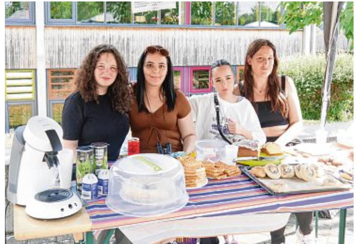
Schülerinnen der 8. Klassen verkauften Kaffee und leckeren Kuchen.

Selbstgemachte Limonade, Waffeln mit frischen Erdbeeren, Kaffee, Kuchen - dazu Bastelaktionen, Kinderschminken, Glücksrad, Infostände, Bewegungsspiele, Eselreiten und musikalische Beiträge - das war das Schul-fest am Bildungszentrum