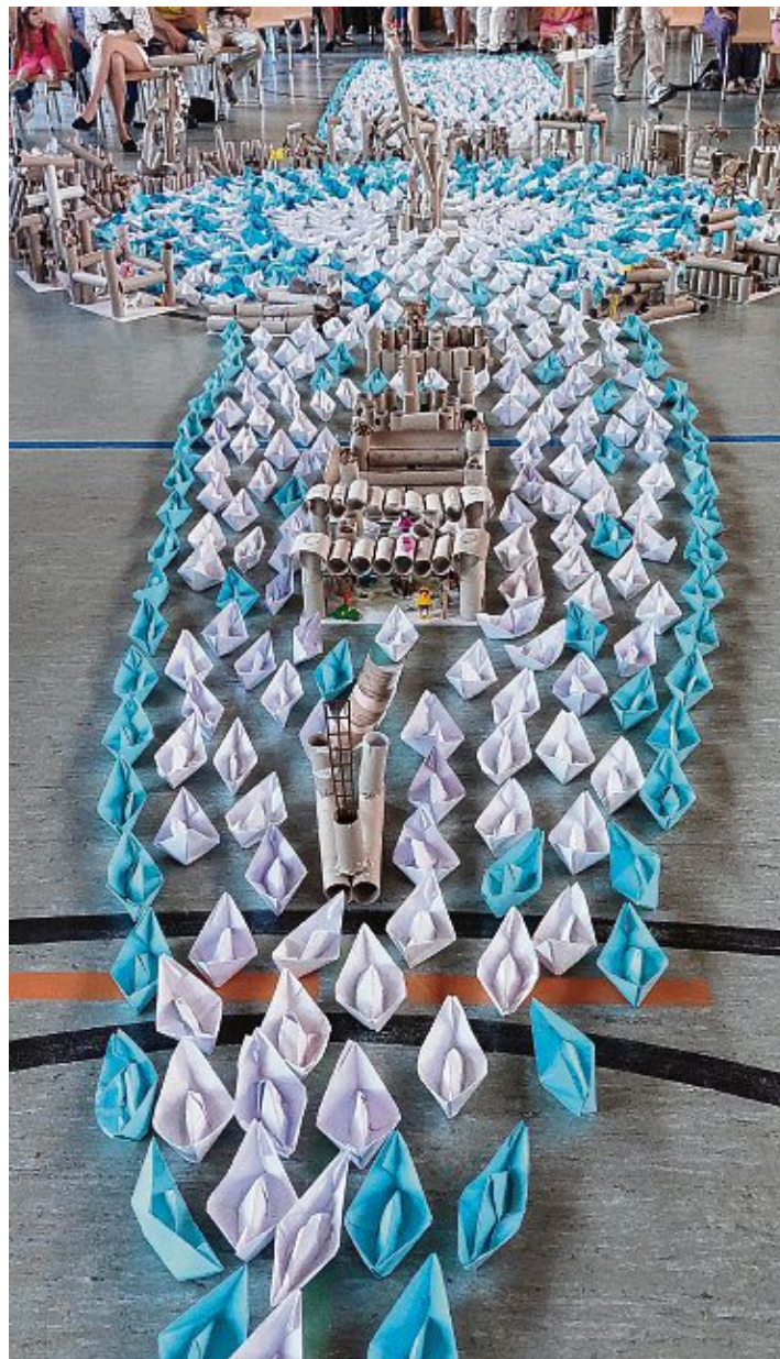
Wie nach Krieg und Zerstörung eine »Stadt der Zukunft« aussehen könnte, in der es sich gut und sicher und im Einklang mit der Natur leben lässt, zeigte diese Installation.