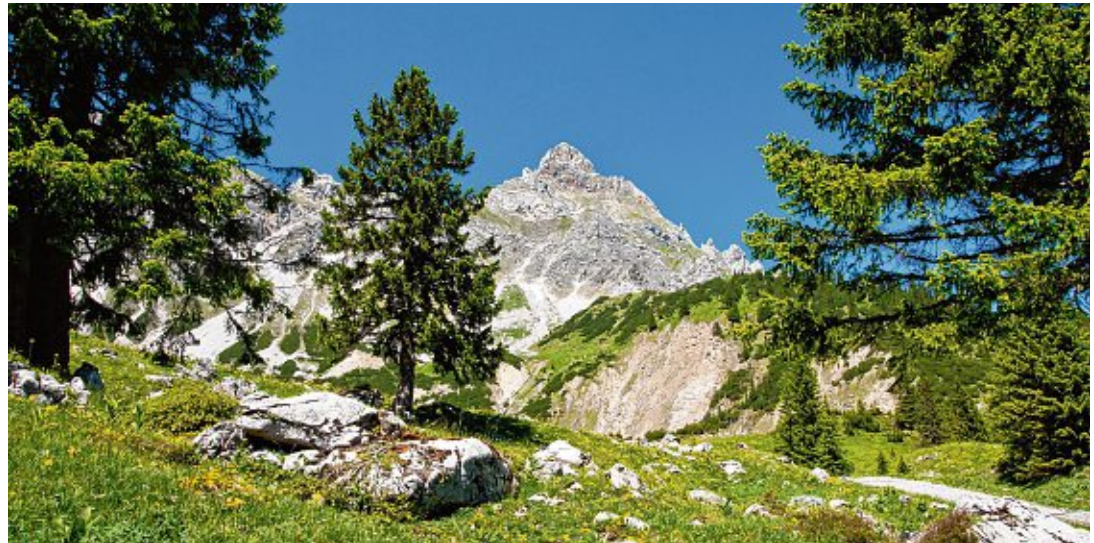
Die Zirbe sorgt mit ihren ätherischen Ölen für guten Schlaf.

Unser Schlafklima wird entscheidend beeinflusst durch die Materialien, aus denen Bettssysteme, Matratzen und Decken hergestellt sind. Naturbelassene Materialien fördern die positiven Effekte eines gesunden Bettklimas. Generell gewährleisten Naturprodukte mehr Erholung im Schlaf als synthetische. Zu bevorzugen sind Bettwaren, die aus hochwertigen natürlichen Rohstoffen gefertigt sind. Vom Naturlatex der Matratze über die Fasern der Auflagen, Decken und Kissen bis hin zu den kompletten metall- und lackfreien Massivholzbetten und Bettssystemen. Insbe-